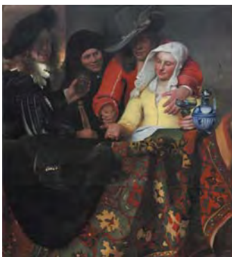
ヨハネス・フェルメール《取り持ち女》 1656年 ドレスデン国立古典絵画館