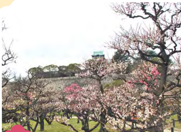
大阪城公園の梅林

境内北の公園にある9品種180本の梅が2~3月にかけて花を咲かせます。2月11日(月・祝)には境内で献梅祭が行われます。