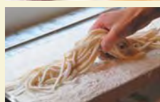
きつねうどん 630円(税込)

手のひらより大きく迫力あるきつねうどんのおあげは、職人による手作りの京揚げを使用。①油抜き②白だしと砂糖で下味③醤油と砂糖で味の仕上げと、3工程で仕込み、「昔懐かしい味わい」と評判です。1日半～2日間熟成させた柔らかくコシのある麺は、3種類的小麦をブレンド。配合は企業秘密とこだわりたっぷりの一杯です。