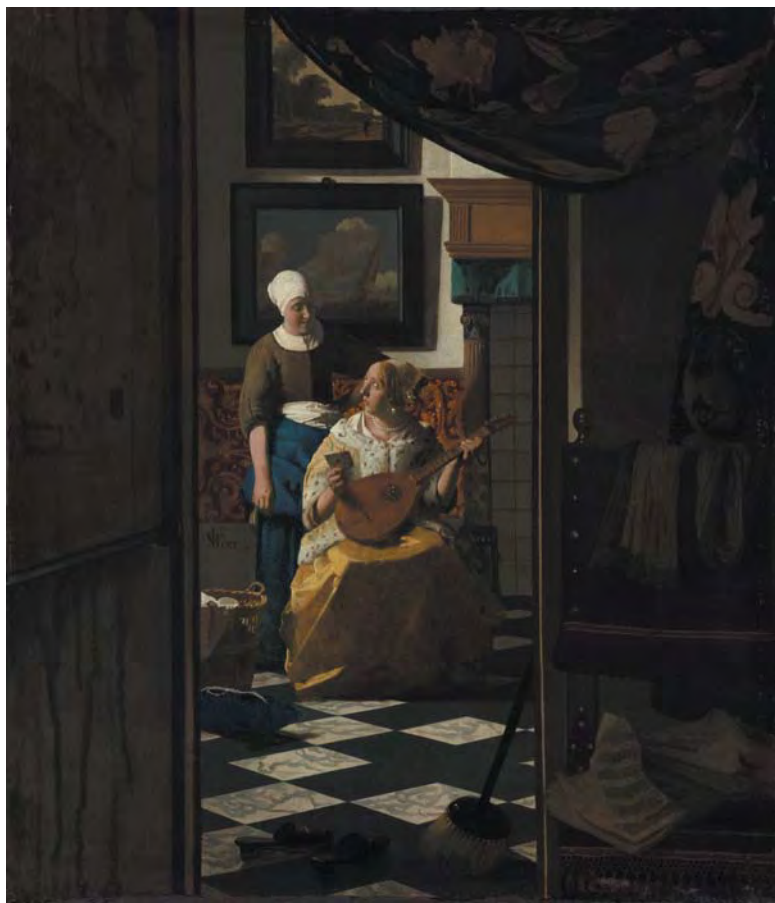
ヨハネス・フェルメール《恋文》1669～1670年頃 アムステルダム国立美術館 Rijksmuseum. Purchased with the support of the Vereniging Rembrandt, 1893 RIJKS MUSEUM