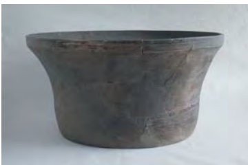
元住吉山I式土器(縄文時代後期) 大阪市中央区森の宮遺跡出土 大阪文化財研究所保管

西日本最大級の貝塚を有する森の宮遺跡。縄文から古墳時代にかけて、遺跡の周辺では、上町台地で狩りをし、河内湾で魚介を採集するなどして人々が暮らしていたことがわかっています。出土した土器から当時の生活や集落の交流の様子を紐解きます。