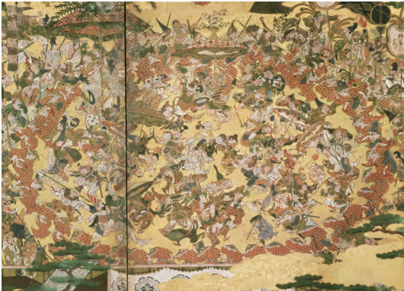
豊国祭礼図屏風 左隻4・5扇下部 徳川美術館 徳川美術館所蔵

ね。今はない踊りなので最初は不安でしたが、屏風絵から群衆の熱気が伝わってきてイメージが湧きました。気分が高揚し、湧き上がって来るのを抑えきれずに体が動いてしまふ、そのような感覚でしょうか。屏風絵の中に入り込み、当時の民衆になりきった気持ちで楽しく踊りました。