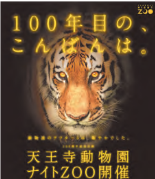
天王寺動物園「ナイトZOO」関連記事10面掲載

入場料は4000円(前売り3500円)・学生2000円(当日のみ)。 ▽生國魂神社天王寺区生玉町13・9、電話06・6771・0002