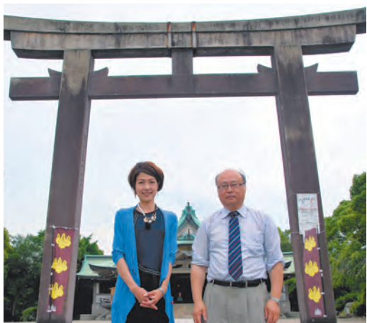
豊臣秀吉を祭る大阪城内の豊国神社で

文楽独特の語りを残しつつ、今の出来事を現代語で舞台化するなど「見せ方」を工夫すれば、文楽の敷居も少しは下がるかもしれません。伝統を守りながら新しいことに挑戦する。それがひいては伝統芸能への関心を高め、ファンを増やし、結果として「伝統芸能を生かす」ことにつながると思うのです。