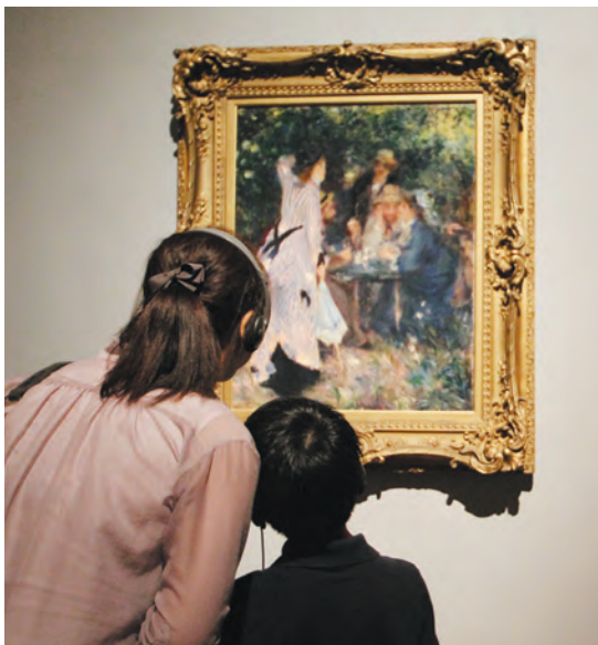
ピエール＝オーギュスト・ルノワール 《庭にて、ムーラン・ド・ラ・ギャレットの木陰》1876年 国立国際美術館 10月14日(日)まで開催中 ※毎週金・土の午後5時～9時は本展の会場内撮影可