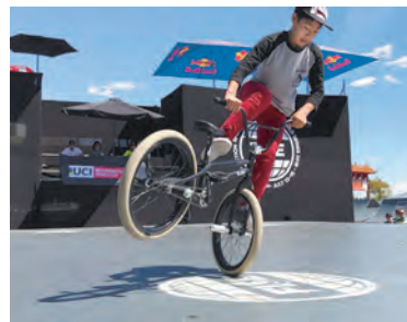
カナダ大会での優勝演技