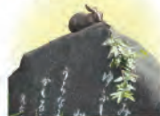
卯の花苑の入口にある歌碑の上