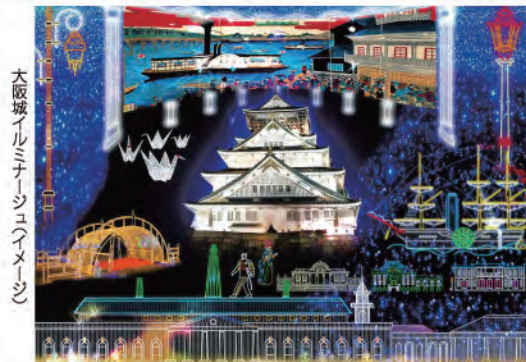
大阪城イルミネーション 幕末・維新・文明開化 大阪城西の丸庭園内特設会場 12/1(土)～翌年3/31(日)

ガラス窓に内側からプロジェクションマッピングを投影させて、夜景と融合した映像が楽しめるイベント。 今年は60階のガラス面に加え、58階のツインタワーにも投影。窓に映る映像が現れるなど、映像の変化も楽しめます。 観覧無料(要観覧券台入場料)午後5時～9時40分 1月10日から、2月7日までは午後6時半～阿倍野区阿倍野駅1・1・43あべのハルカス60階 電話06・6621・0330