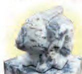
ひすい な 翡翠の置る兎(第四本宮前)

住吉大神が卯(=兎)年の卯月、卯の日に御鎮座なされたことに因み、住吉大社では「兎」が神様の使いとされています。境内には、あちこちにうさぎが……。