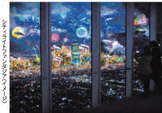
CITY LIGHT FANTASIA by NAKED - ANNIVERSARY - ハルカス300 開催中～翌年3/31(日)