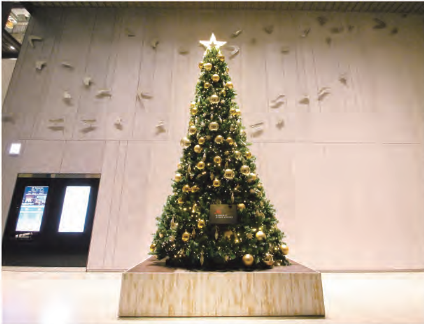
大阪マリオット都ホテルのロビースペースで出迎えてくれるシンプルでゴージャスなツリー(高さ約5m)