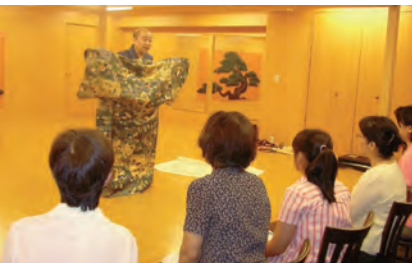
能について学べる講座

同展の無料招待券を10組20人にプレゼント。ご希望の方は、はがき・FAXまたはEメールで編集局まで応募ください。10月10日締め切り。