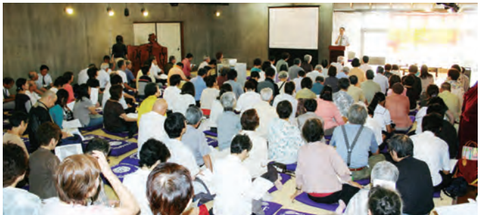
「日想観の会」会場の様子（上）と一心寺方丈導師による「六字誹念仏」の様子（下）

さて、今回の「日想観の会」、彼岸の行事ということで今後の開催は定例化するのでしょうか。ぜひ夕陽丘の地名の由来となったこの行事が地域の名物となるよう続けてもらいたいものです。