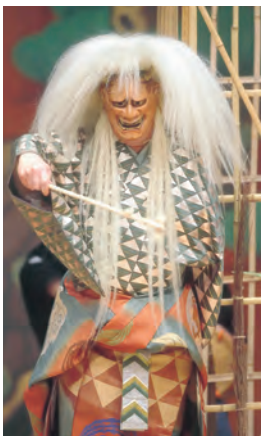
能「安達原」の一場面

「安達原」は陸奥（むつ）に伝わる伝説をもとに人間の二面性を描いた、分かりやすい初心者向けの人気曲です。故・観世榮夫氏が舞う予定でしたが、6月