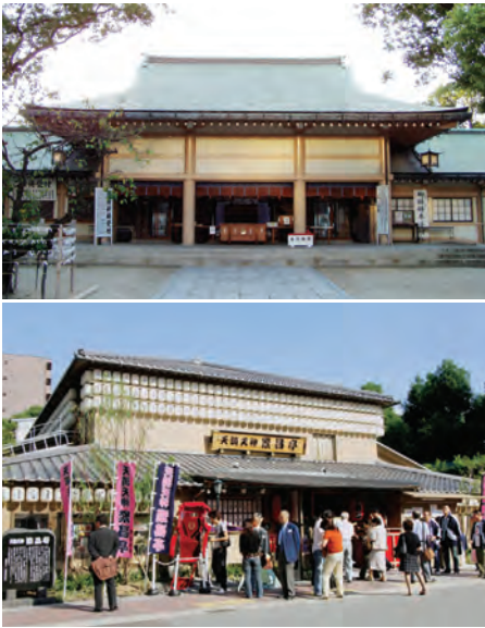
生國魂神社(上)と天満天神繁昌亭(下)

大阪市と大阪観光コンベンション協会では「大阪まちあるき」と題し、音声ガイドを聴きながらウォーキングを楽しめる観光ルート