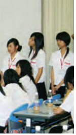
交流する生徒たち

9月12日、清水谷高校に台湾の名門校、高雄女子高級中学と高雄高級中学（男子校）の生徒82人、引率・関係者ら計100人が訪問しました。