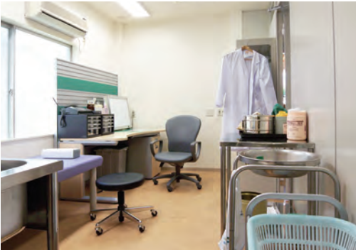
一心寺「慈泉処」の医務室

その中から路上生活の様子や悩み・困り事などが少しずつ分かるようになってきました。けが・感染症・病気に対する不安、困ったときや苦しいときに診療が受けにくい事情など、さまざま