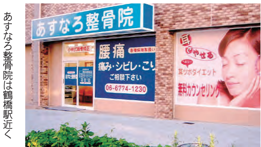
あすなる整骨院は鶴橋駅近く

10月で開院3周年を迎えるあすなる整骨院は「小林式背骨矯正法」による施術で肩凝りや頭痛、ぎっくり腰、椎間板(ついかんばん)ヘルニアなど、つらい痛みや気になる症状の緩和をサポートしています。小林式背骨矯正法は背骨のゆがみを矯正し、体のバランスを整えて血流を良くし、筋肉の緊張をほぐして自然治癒力を高めます。