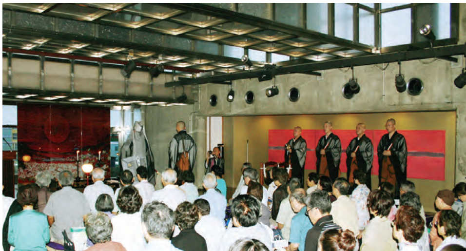
一心寺日想観で開かれた「日想観の会」