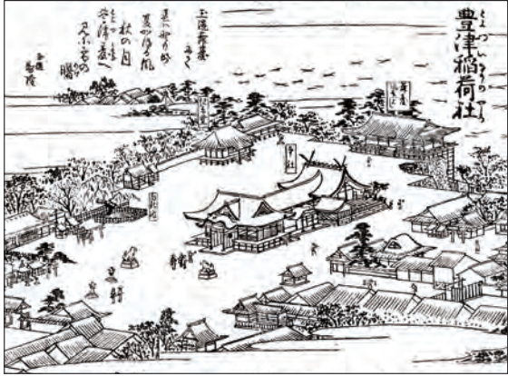
摂津名所図会 巻三 豊津稻荷社（部分）

上町台地、天王寺は国内外に誇る有名な寺院や史跡・名所が数多くあり、歴史・文化の宝庫といわれています。大阪市内で緑が残る限られた