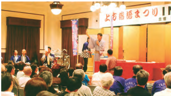
上方落語まつり I N天王寺の様子

天王寺区商店会連盟主催、上方落語協会が協賛する「第9回上方落語まつり I N天王寺」が8月28日から始まります。 「上方落語まつり I N天王寺」は天王寺区のふれあい事業として1996年から商店会の継続的な活性化を図ろうと始めたものです。天王寺は上方落語の発祥の地でもあり、大阪の 天王寺区商店会連盟主催、上方落語協会が協賛する「第9回上方落語まつり I N天王寺」が8月28日から始まります。 「上方落語まつり I N天王寺」は天王寺区のふれあい事業として1996年から商店会の継続的な活性化を図ろうと始めたものです。天王寺は上方落語の発祥の地でもあり、大阪の