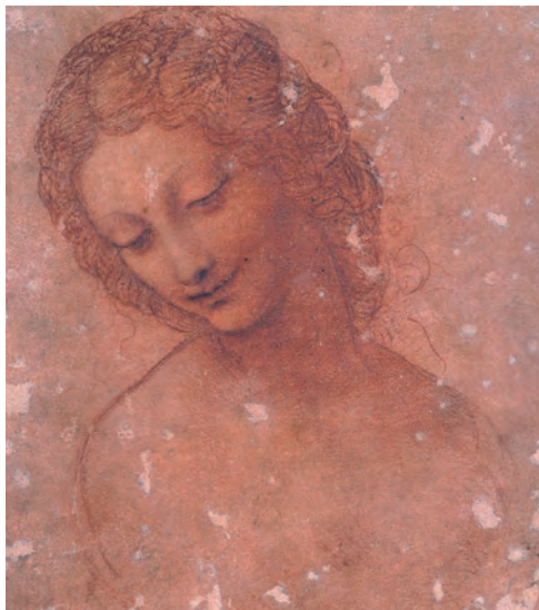
レオナルド・ダ・ビンチ「レダの頭部」 （スフォルツァ城市立博物館所蔵）

市の全面協力を得て、スフォルツァ城市立博物館やブレラ美術館などミラノの美術館・博物館が所