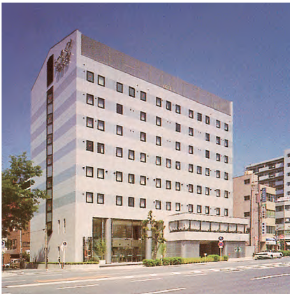
上町筋に面した「トークインなになわ」