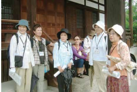
天王寺の見どころをボランティアガイドとともに散策

上町台地、天王寺は国内外に誇る有名な寺院や史跡・名所が数多くあり、歴史・文化の宝庫といわれています。大阪市内で緑が残る限られた