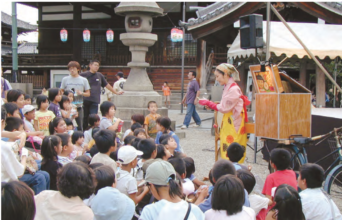
一心寺で開催された地蔵盆。紙芝居に集まった子どもたちは大喜び（写真は昨年の風景）