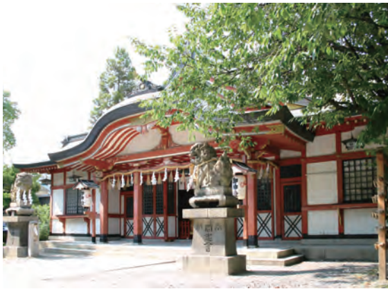
緑豊かな玉造稻荷神社の境内

この舞台は現在ありませんが、その斜面には豊かな緑が残っているというわけです。南側の神社正門には豊臣秀頼寄進と伝えられる慶長8年（1603年）建立の石鳥居も立っており、豊臣時代の上町台地の歴史をしのぶこともできます。