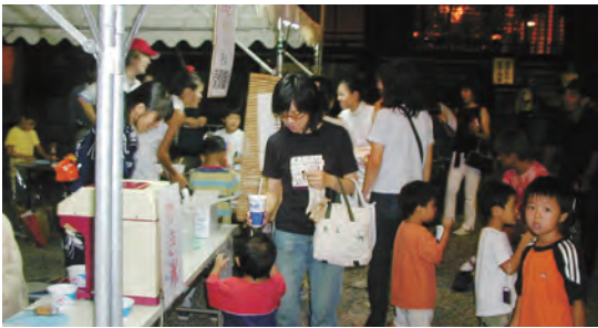
地蔵盆の夜店で楽しむ親子