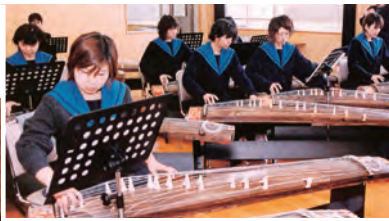
和楽器に取り組む生徒（上）と定期演奏会の様子（下）