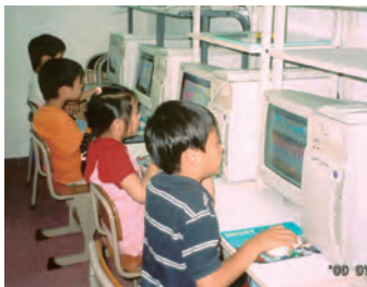
パソコンで図形を学ぶ子どもたち

めばえ幼児才能学園は子どもの才能を無理なく自然に伸ばす教室を開校しています。幼児教育専門校のノウハウを生かし、子どもたちの心を把握し、少数人数で分かりやすいレッスンをしています。 ピタゴラスコースは、小学1〜3年生を対象に幾何的な形の成り立ち、面積、角度、対称形の意味、ピタゴラスの定理の証明法などを、プリント学習だけではなく、作図や立体、コンピュータ学習など多方向からのアプローチで数学的思考力、理解力を高めます。難易度の高い中学校ほど入学試験で能力が問われます。 算数コースは1学年上の内容を先取り。計算や数の構成、長さや重さ、時刻と時間など基礎概念を重視し、中学入試を踏まえたカリキュラムです。 読解国語コースは国語学習に必要な読解力・表現力を高めます。読書の習慣を身に付け、文章を書く機会を多く持たせ、国語力全般の能力を活用する力を養います。 ▽めばえ幼児才能学園 大阪本部教室 I N天王寺区東高津町11-7、電話06・6763・2201