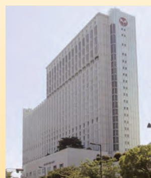
都ホテル大阪外観

レディースクラブは入金不要、年会費5000円で、宿泊・レストラン・ブライダル料金の割引、ティー&ケーキ券5枚（6000円相当）プレゼント、会員