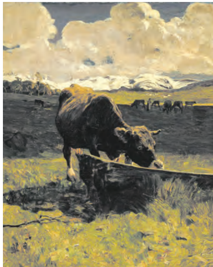
ジョバンニ・セガンティーニ「水を飲む雌牛」 （ミラノ市立近代美術館所蔵）

ミラノは紀元前4世紀からの歴史を有し、街並みには中世の名残をとどめながらも最新流行ファ