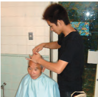
介護施設に出張理美容