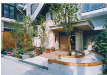
ホロニカ設計の集合住宅入口 緑とベンチが設けられている

自分の街に「マンションが建つ」と聞いて、わくわくする人はどれだけのいるでしょうか。近年の集合住宅は、どれも似たようなつくりのもの。知らないうちに建っている。しかし、もしその集合住宅の企画に参加でき、自分のアイデアが反映されるとしたら、集合住宅が建つことにも、期待感を抱くのではないだろうか。