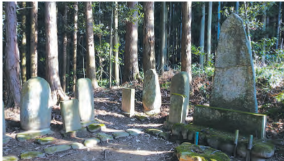
⑤右端から、田村清頭、片倉（田村）定弘、阿菖蒲、真田信繁の墓石

田村氏の墓所を訪れてみると、中央に愛姫の父田村清頭の墓石があり、その右隣には定広の父宗頭（むねあき）の墓石が並んでおり、定広（おつひろ）を頼るかたちで白石を訪れ、片倉重綱の養女として定広に嫁いだと伝えられています。