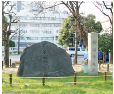
難波宮内の「歩兵第八連隊の跡」 軍隊の施設が集中していた場所

上町台地の井戸水が 多くの軍馬の命を救った うえまち編集局には、現在上町台地に住んでいる人だけでなく、過去に住んだことがある、企業や学校に通っている、観光に訪れたなど、さまざまな人からの声が寄せられます。土地にまつわる言い伝えや誰かに伝えたい体験談、個人的な思い出、より良いまちにするための提言などその内容はいろいろ。今回は編集局に寄せられたお便りを、ご紹介させていただきます。