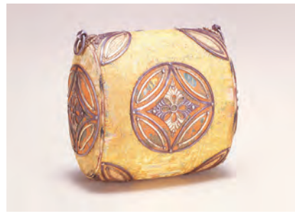
国宝 七宝花菱文の懸守

新年が明け、少々時間もたつてしまいましたが、1月とうい月が持つ華やかさ、そして心躍らせてくれる雰囲気はまだどこに残っているように思われます。旧正月の行事を行う地区もあり、新年の初