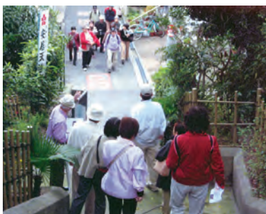
てんのうじ観光ボランティア・ガイド協議会のガイドの様子