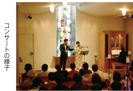
コンサートの様子

生とその保護者が1階エントランスホールに集合。日本風の会大阪支部の会員を先生に「するめいか」と呼ばれる風の作り方を教わりました。その後は完成した風を持って難波宮跡へ。自分たちが作った風が風をとらえて見事青空に舞い上がると、ひととき大きな歓声が上がりました。